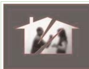
Porodicno nasilje u Makedoniji je u rastu, izvestava lokalna NVO

prodane na aukciji tokom Maja meseca u Kontinental Hotelu Skopje.