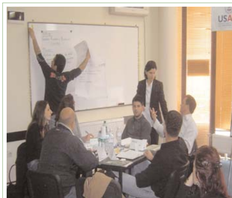
Radionica u ATRC-u 20 Aprila

Za više informacije u vezi etickog koda za NVO, kontaktirajte: organizatacohu@yahoo.com