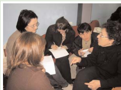
Članovi MKZ diskutuju strateski plan mreže za 2005 na godisnjem sastanku članstva.

Mreža Kosovskih Zena (MKZ), koja zastupa u ime žena na lokalnom, regionalnom i međunarodnom nivou, sada ima 85 uclanjenih organizacija predstavnika svih narodnosti na Kosovu, cineci jednu od najvećih funkcionalnih mreža u regionu.