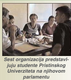
Sest organizacija predstavljaju studente Pristinskog Univerziteta na njihovom parlamentu

Hoti je izjavio da tokom svog mandata parlament će sluziti kao zastitni mehanizam za studentska prava. Sedamnaest članova od ukupno šest studentskih organizacija (Studentski Nezavisni Savez Kosova, Studentski Mir, Studentska Lista-Reforma, Nova Studentska Organizacija, i Savez Albanskih Studenata) su predstavljeni u parlamentu.