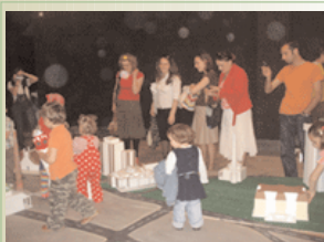
Participants at the "Discover Prishtina" exhibition on May 11

Izložbu "Otkrijte Prištinu" podržao je ATRC i IREX, u sklopu Programa civilnog društva Kosova.