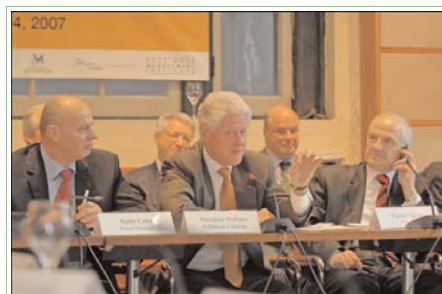
Rockefeller Brothers Fund organized a conference on April 12-14 in New York about Kosovo future. In photo: President Clinton addressing the conference participants.

"U ovome se ogleda procena RFB da pomoc u izgradnji tolerantne i pluralisticke demokratije i promocija odrivog razvoja u regionu predstavlja vrhunske prioritete koji ce imati znacajnog uticaja". Informacije o nacinama prijavljivanja, procesu dodele grantova kao i dodatne informacije o RFB programima mogu se naci na www.rbf.org .