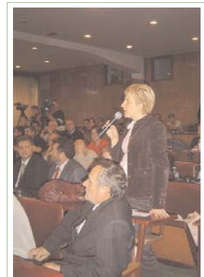
A citizen raises concerns about the outcome of Kosovo status settlement on May 22

Za celokupni predlog statusa, pogledati www.uno-sec.org