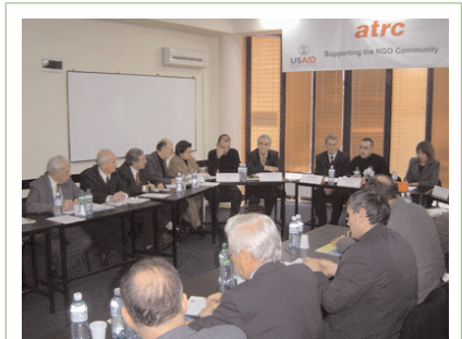
Të pranishmit diskutojnë sistemin pensional në Kosovë

blik në kuadër të një serie të debateve të ATRC-së dhe KODI-it për çështje të mbrojtjes sociale dhe po ashtu rasti i parë për të debatuar çështjet pensionist nga përfaqësues të sektorëve të ndryshëm.