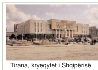
Tirana, kryeqytet i Shqipërisë

fit; mungesa e procedurave të cilat udhëzojnë punëtorët në punët e tyre ditore për të siguruar transparencën dhe të kontrollojnë nëse të gjitha çështjet janë në përputhshmëri me funksionet e tyre. Gjithashtu, OJQ-të kanë nevojë për përkrahje në menaxhimin e tyre të brendshëm, në performimin e vlerësimit të nevojave dhe shkruarjes së projekt propozimeve. OJQ-të dhe grupet e komunitetit kanë nevojë për një forum në të cilën do të kenë mundësi të takohen me qeverinë lokale dhe të trajnohen. Institucionet e shoqërisë civile kanë demonstruar një numër të madh të avantazheve krahasuar me institucionet ekzistuese shtetërore. Ato janë më fleksibile dhe më të adaptueshme ndaj ndryshimeve të shpejta të kushteve; ato janë më kreative