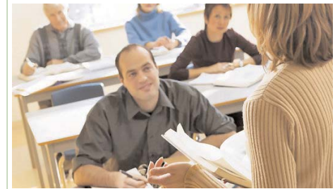
EAEA avokon për arsimimin e të rriturve dhe për OJQ-të që punojnë në këtë fushë

Shoqata Evropiane për Arsimimin e të Rriturve (EAEA) është OJQ evropiane me 114 organizata anëtare nga 41 vende të cilat punojnë në fushën e arsimit të të rriturve. EAEA avokon për arsimimin e të rriturve dhe për OJQ-të që punojnë në këtë fushë. Kjo shoqatë organizon seminare informativ për të ngritur vetëdijen për programet e BE-së dhe politikat zhvillimore. EAEA po ashtu organizon trajnime për burimet e financimeve evropiane për arsimimin e të rriturve. EAEA promovon zhvillimin e arsimit tek të rriturit në nivel evropian dhe lobon tek trupat ndërkombëtar që ata të miratojnë plane dhe politika që iu përshtaten nevojave të popullatës së rritur në Evropë. Ajo nxit bashkëpunimin në Evropë dhe ndihmon OJQ-të të punojnë së bashku dhe të luajnë rol aktiv në skenën ndërkombëtare. Qëllimet kryesore të kësaj shoqate janë avokimi për politikat