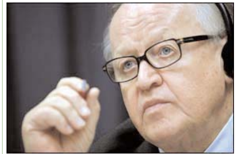
Koalicioni i Grave për Paqe nga Kosova dhe Serbia i ka dërguar letër Ahtisaarit më 12 shkurt në përkrahje të pavarësisë së Kosovës

Së dyti, lokalitetet kulturore nuk duhet të shfrytëzohen si mjete politike drejt homogjenizimit të komuniteteve në Kosovë. Kjo do të shpie drejt izolimit dhe ndarjes së ko-