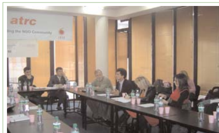
Përfaqësues të OJQ-ve, mediave dhe biznesit shqyrtuan rolin e qytetarëve ndaj taksave publike më 16 shkurt

"Qytetarët e Kosovës nuk janë në dijeni për rëndësinë e pagimit të taksave