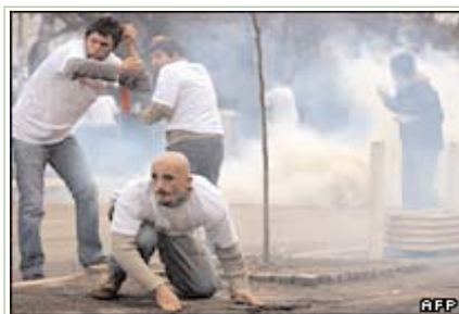
Protesta e dhunshme në Prishtinë më 10 shkurt

Përfaqësues të shoqërisë civile diskutuan për protestën e organizuar më 10 shkurt në Prishtinë nga lëvizja Vetëvendosja. Dy protestues vdiqën nga lëndimet pasi policia sulmoi me gaz lotsjellës dhe plumba gome për të ndaluar një turmë të drejtuar drejt ndërtesave qeveritare. Pasojat e kësaj proteste janë shqyrtuar më 14 shkurt gjatë një tryeze të rumbullakët të organizuar