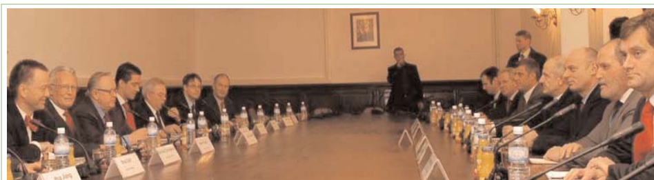
Ahtisaari i paraqiti propozimin e tij Ekspit të Unitetit të Kosovës më 2 shkurt

Për të lexuar propozimin e plotë, vizitoni www.uno-sek.org