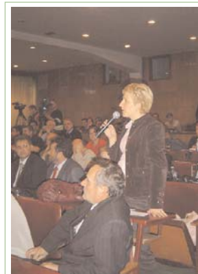
Një qytetare shpreh shqetësim për rezultatit e përcaktimit të statusit të Kosovës

Rezoluta e ardhshme për Kosovën e Këshillit të Sigurimit të OKB-së; roli i Rusisë në procesin e zgjidhjes së statusit; sfidat e implementimit të pakos së Ahtisaarit dhe funksionaliteti i shtetit të Kosovës; dhe procesi i decentralizimit janë çështjet që shqetësojnë më së tepërmi pjesëmarrësit.