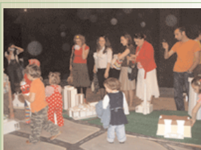
Pjesëmarrësit në ekspozitën "Zbulo Prishtinën" më 11 maj

Ekspozita "Zbulo Prishtinën" është përkrahur nga ATRC dhe IREX në kuadër të Programit Kosovar për Shoqëri Civile.