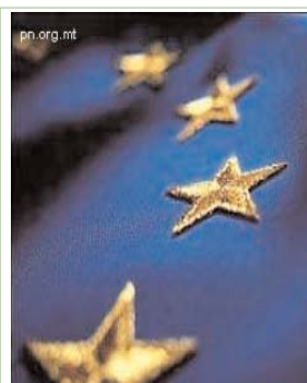
Gjatë periudhës 2008-2010, Qendra Palme do të fokusohet në pjesëmarrjen e qytetarëve në vendim-marrje, dhe aftësinë e organizatave të shoqërisë civile dhe administratave lokale që të përfitojnë dhe marrin pjesë në procesin e zgjerimit të BE-së

Qendra Ndërkombëtare Olof Palme, organizatë suedeze kjo, ka shpallur në maj rundin vjetor të granteve në kuadër të Programit për Ballkanin Perëndimor, të financuar nga Agjencia Suedeze për Zhvillim - Sida.