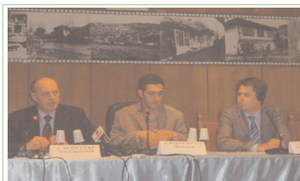
Kryeministri, Agim Çeku, u sqaroi më 22 maj qytetarëve të Prishtinës procesin e zgjidhjes së statusit të Kosovës

Përfaqësues të qeverisë lokale dhe asaj qendrore, OJQ-ve, mediave dhe sektorit të biznesit në pesë rajonet e Kosovës kanë pasur mundësi të informohen, shqetësimet e tyre të dëgjohen dhe të bëjnë pyetje për procesin e zgjidhjes së statusit të Kosovës, gjatë pesë takimeve publike të organizuara nga ATRC-ja në muajin maj.