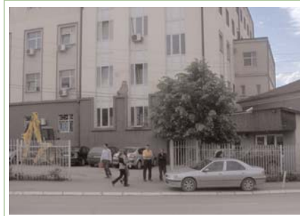
Rrjeti i Radiove për të Drejtat e Njeriut monitoron shfrytëzimin e automjeteve zyrtare në 6 komuna

Zyrtarë të Komunës së Prizrenit i kanë përdorur automjetet zyrtare pa ndonjë rregullore/urdhër administrativ, i cili do të autorizonte rregullat dhe qëllimet e shfrytëzimit të automjeteve në Prizren.