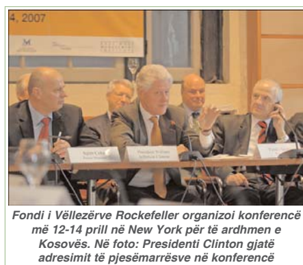
Fondi i Vëllezërve Rockefeller organizoi konferencë më 12-14 prill në New York për të ardhmen e Kosovës. Në foto: Presidenti Clinton gjatë adresimit të pjesëmarrësve në konferencë

Mënyra e aplikimit, procesi i grant dhënies dhe informata shitesë për programet e RBF-së mund të gjinden