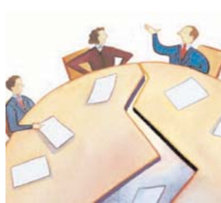
"Partners-Kosova" është OJQ vendore e themeluar në vitin 2001 për të përhapur kulturën e zgjidhjes paqësore të konflikteve në Kosovë

Fushat kryesore të punës së kësaj qendre janë: ndërmjetësimi, reformimi i qeverisjes lokale, integrimi etnik & zgjidhja e konflikteve. Programet kryesore përfshijnë shërbimet e ndërmjetësimit; programin e qeverisjes vendore; dhe