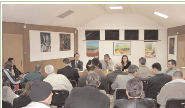
Ekspertët u sqarojnë qytetarëve të Rahovecit pakon e Ahtisaarit më 27 mars

"Pakoja e Ahtisaarit përbehet nga parimet e përgjithshme të cilat hapin rru-