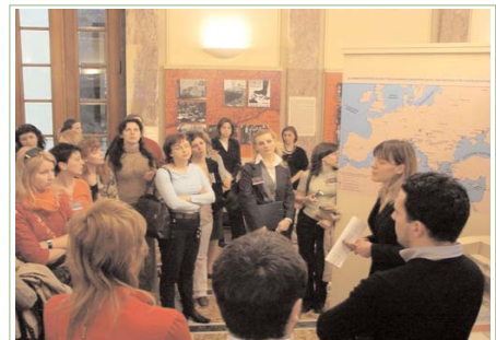
Vizita e pjesëmarrësve në Parlamentin grek më 1 mars