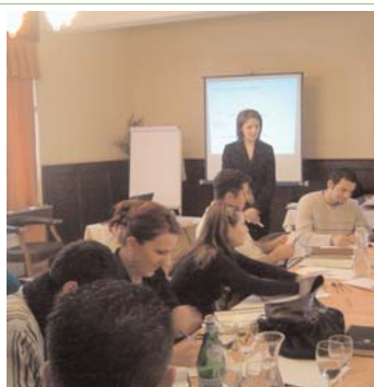
Sesion trajnimi në Istog më 27 mars

timi dhe forcimi i marrëdhënieve ndërmjet këtyre dy sektorëve mund të shërbejë edhe si bazë në përkrahje të projekteve të tjera që kanë të bëjnë me demokracinë dhe ruajtjen e paqes