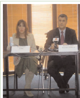
Hashim Thaçi informoi OJQ-të lokale për sfidat e opozitës

Shumica e pjesëmarrësve veçan se OJQ-të dhe institucionet qeverisëse duhet t'i kontribuojnë debatit të përgjithshëm të inicuar nga shoqëria civile për çështjet që shqetësojnë qytetarët e Kosovës, dhe po ashtu të inicojnë formë të re komunikimi ndërmjet këtyre dy sektorëve.