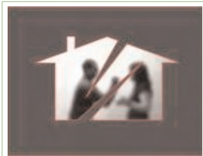
Dhuna familjare është në rritje e sipër në Maqedoni, raportojnë OJQ-të lokale

ten këtë muaj në një ankand në Hotelin Kontinental në Shkup.