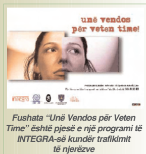
Fushata “Unë Vendos për Vetën Time” është pjesë e një programi të INTEGRA-së kundër trafikimit të njerëzve

INTEGRA po e implementon këtë fushatë në kuadër të programit të saj kundër trafikimit të qenieve njerëzore, të përkrahur nga Organizata Ndërkombëtare për Migrim (IOM), Qeveria e Finlandës, dhe Zyra e Kryeministrit për Qeverisje të Mirë.