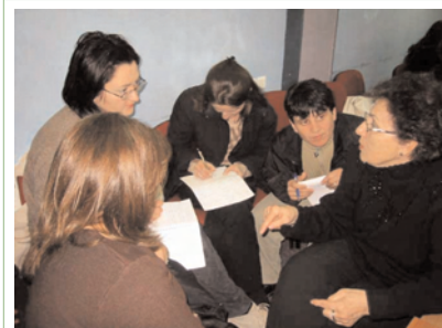
Anëtarët e RrGK-së shqyrtojnë planin strategjik të rrjetit për vitin 2005 gjatë një takimi vjetor të anëtarësisë

Rrjeti i Grave të Kosovës (RrGK), i cili avokon në emër të grave në nivel lokal, rajonal dhe ndërkombëtar, aktualisht përbëhet nga 85 organizata anëtare të të gjitha etniteteve nga mbarë Kosova, gjë që e bën atë një ndër rrjetet më të mëdha funksionale në rajon.