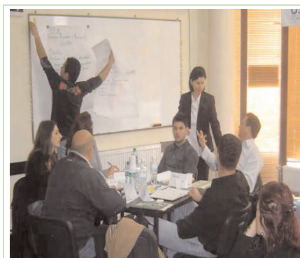
Sesion trajnimi në ATRC më 20 prill

Për më shumë informata lidhur me kodin e etikës për OJQ-të, ju lutem kontaktori: organizata-cohu@yahoo.com