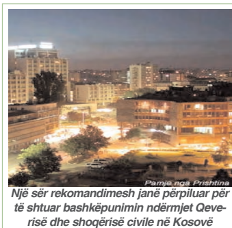
Një sër rekomandimesh janë përpiluar për të shtuar bashkëpunimin ndërmjet Qeverisë dhe shoqërisë civile në Kosovë

Përfaqësues të OJQ-ve dhe këshilltarët politik përpiluan disa rekomandime, me qëllim të krijimit të marrëdhënieve më të ngushta ndërmjet qeverisë dhe sek-