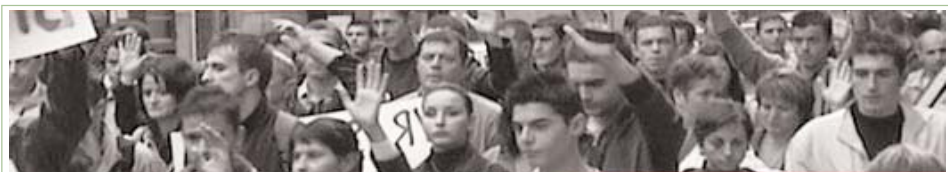
Rreth 50.000 qytetarë shqiptarë kanë protestuar në Tiranë kundër presionit të Qeverisë ndaj medias, në një protestë paqësore të organizuar nga lëvizja "Mjaft" në muajin prill

Për më shumë informata, vizitoni: www.mjaft.org