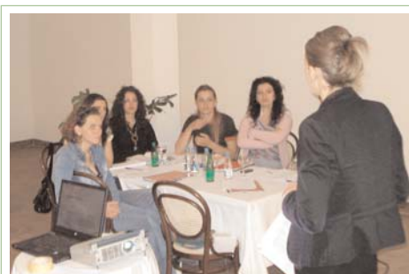
Sesion trajnimi në qytetin e Gjakovës më 31 maj

Rrjeti i Grave të komunitetit RAE është sektor tjetër i shoqërisë civile, të cilin ATRC-ja e ka përkrahur në ngritje të kapaciteteve organizative përmes trajnimeve për shkrim të projekt propozimeve, rolin e OJQ-ve në shoqërinë civile, monitorim dhe vlerësim, qe-