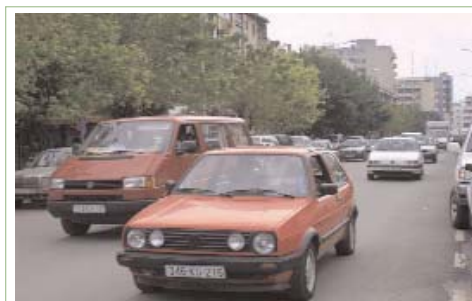
Qytetarët e Prishtinës kanë porositur zyrtarët komunal të punojnë për interesat e qytetarëve, sipas një hulumtimi të OJQ-së "Mileniumi i Ri"

Shumica e qytetarëve të Prishtinës nuk janë të kënaqur me menaxhimin e fondeve publike në qytetin e tyre dhe me punën e Asamblesë Komunale. Ky është rezultati i hulumtimit të kryer nga OJQ Mileniumi