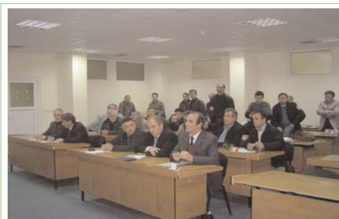
Përfaqësues të qeverisë qendrore dhe lokale dhe shoqërisë civile diskutuan për procesin e decentralizimit në Komunën e Deçanit më 24 nëntor

Publikimi i këtij buletini mundësohet nga përkrahja zemërgjerë e popullit amerikan nëpërmjet Agjencisë për Zhvillim Ndërkombëtar të Shteteve të Bashkuara (USAID). Përmbajtja është përgjegjësi e ATRC-së dhe nuk reflekton detyrimisht qëndrimet e USAID-it ose Qeverisë së Shteteve të Bashkuara.